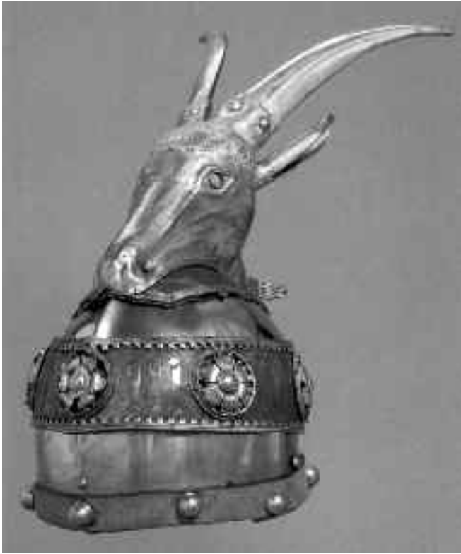
Шлем Скендербега изложен у Велт музеју у Бечу (Weltmuseum Wien). Реплика шлема се може набавити преко сајта: www.skenderbeg.rs