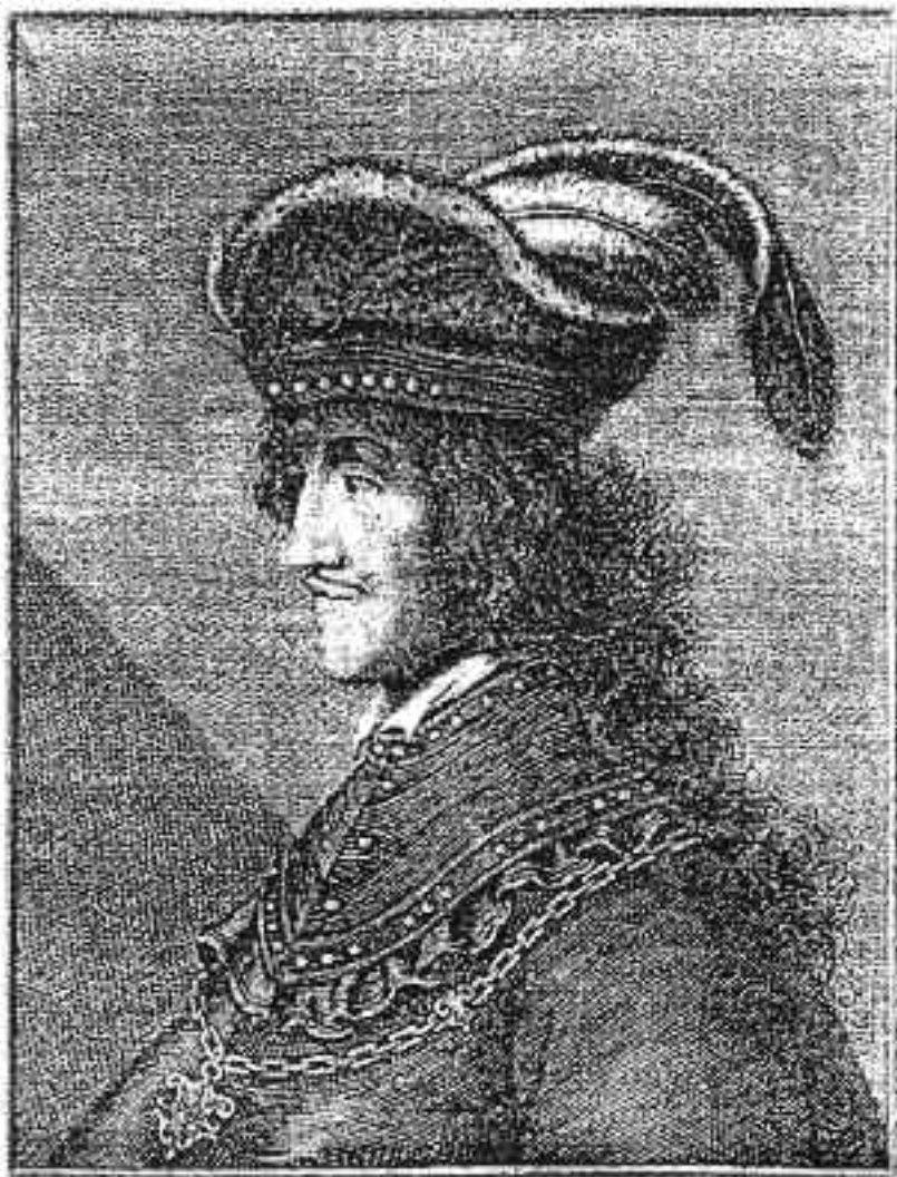
Портрет Турађа Другог Кастриота из 1648. г.