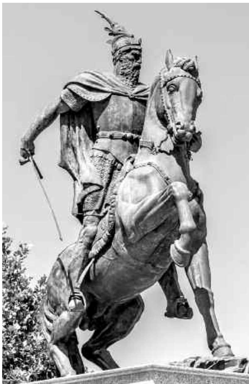
Ђурађ Кастриот Скендербег