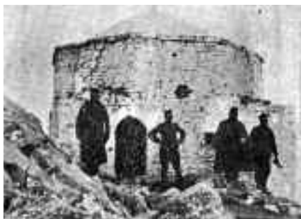
Српски борци за време балканских ратова испред гроба Скендербега у старом утврђењу града Љеша.

Скендербег је сахрањен у православној цркви свети Никола у старом утврђењу града Љеша (данашња Абанија), које се налази на брду изнад данашњег града Љеша. Данас се гроб Скендербега лажно приказује да се налази у католичкој цркви свети Никола која се налази недалеко од центра данашњег града Љеша.