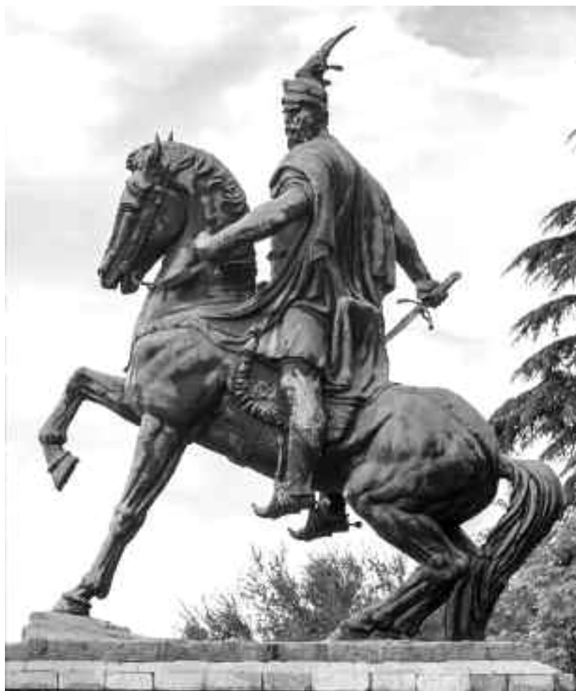
Ђурађ Кастриот Скендербег