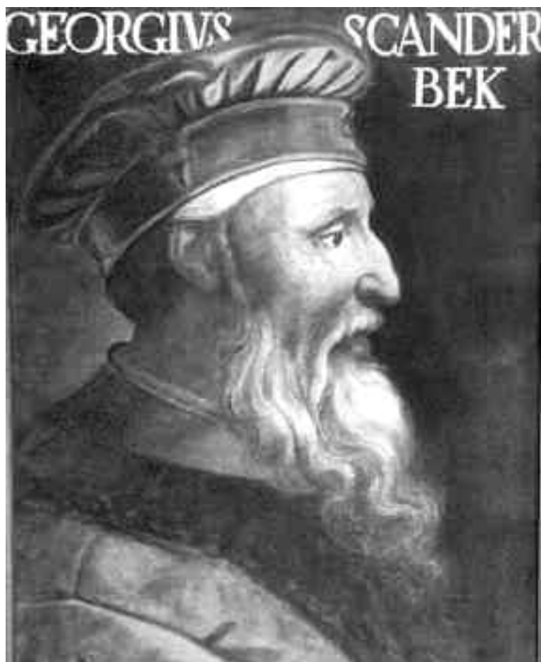
Најпознатији портрет Ђурађа Кастриота Скендербега који је изложен у музеју у Фиренци.