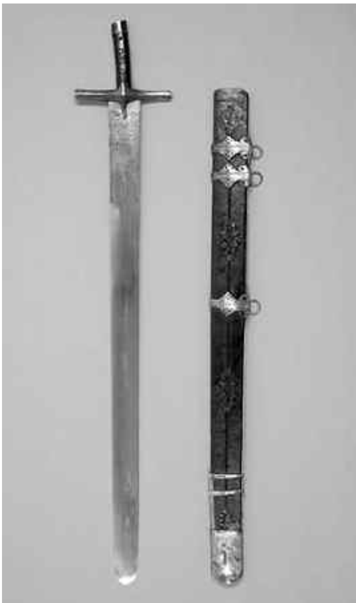
Сабља Скендербега изложена у Велт музеју у Бечу (Weltmuseum Wien).