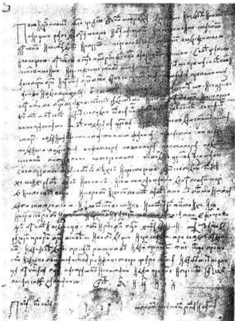
Повеља Јована Кастриота манастиру Хиландар о донацији два села из 1426. године.