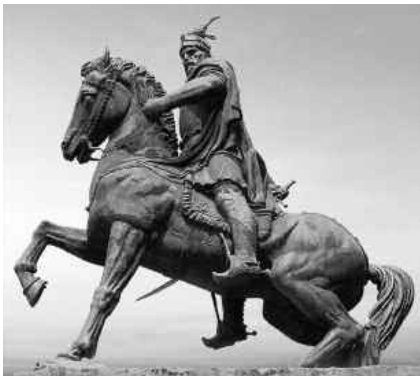
Ђурађ Кастриот Скендербег