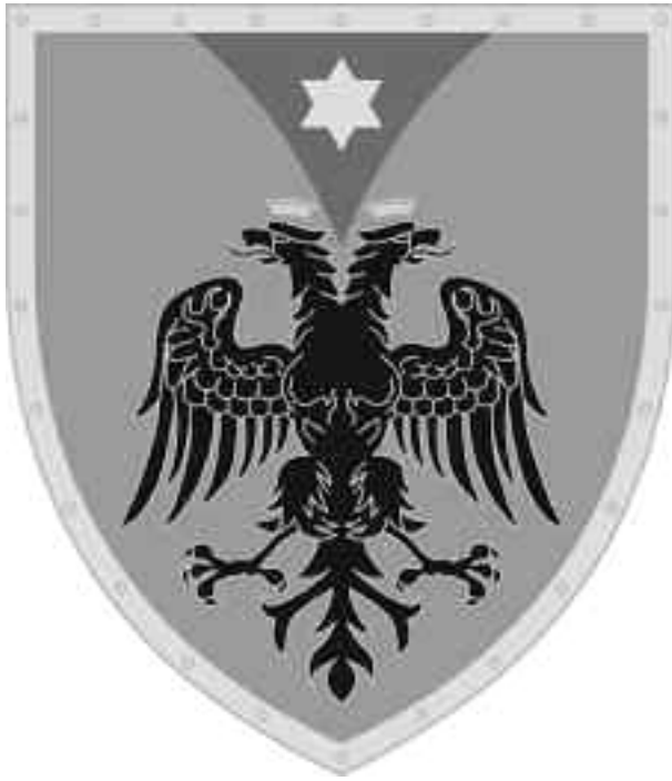
Грб Ђурађа Кастриота Скендербега