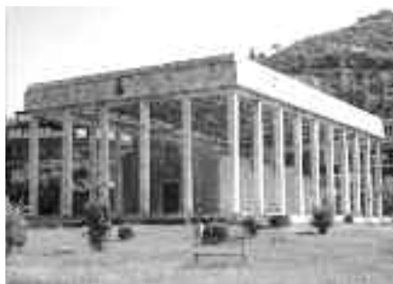
Католичка црква свети Никола у Љешу, покривена и опасана стубовима, наводни гроб Скендербега.